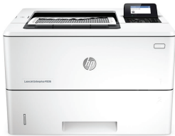
HP LaserJet Enterprise M506dn