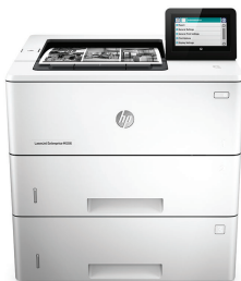
HP LaserJet Enterprise M506x