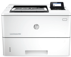
HP LaserJet Enterprise M506n

Accomplissez vos tâches principales plus rapidement avec une imprimante qui démarre immédiatement et vous aide à économiser de l'énergie. 1 La sécurité à plusieurs niveaux de l'appareil vous protège contre les menaces. Les toners HP authentiques avec JetIntelligence permettent d'imprimer plus de pages de haute qualité. 2