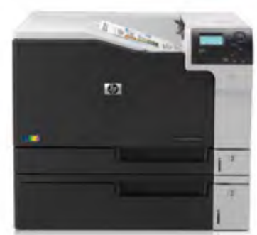
HP Color LaserJet Enterprise M750n

Fonctionnalité d'impression mobile 10 : HP ePrint, Apple AirPrint MC